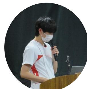
▼講演中の会場の様子(田老公民館大会議室)